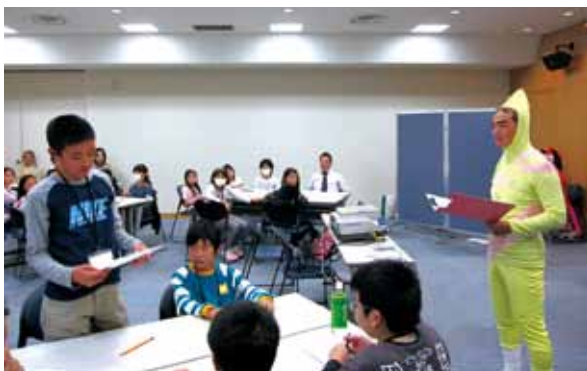
各班による発表風景。右はTVのキャラクターに扮した司会・進行役の弁護士。

その後、教師役の弁護士から、「言い分を聞くにしても、その方法についてきちんと（適正に）する必要がある」ということや、「仮に本人が認めた（自白した）としても、それが真実なのかどうか、本当に犯人なのか十分考える必要がある」という説明がなされました。