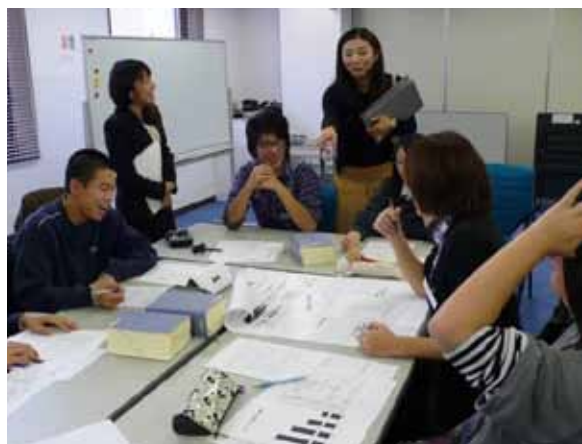
グループでのディスカッションの様子。

学生には上記の事例について、配付されたワークシートに沿って次のような問題点を検討してもらいました。